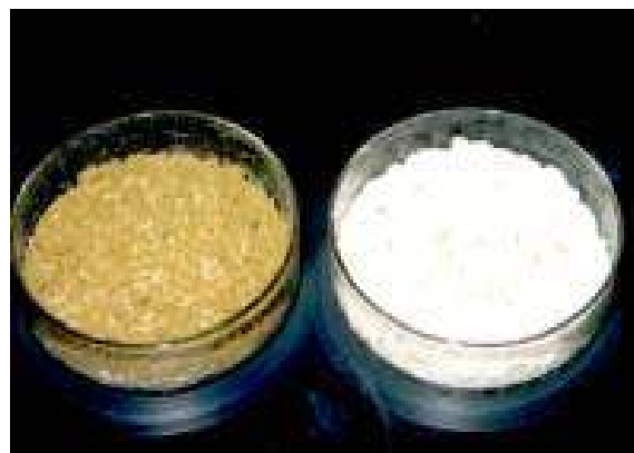
Foto 2. Ragi biak induk Aspergillus sp. K-1 (kuning); ragi biak mutan Aspergillus sp. K-1A (putih).