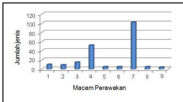
Gambar 1. Macam perawakan tumbuhan di Way Canguk dan Sukaraja Atas. Keterangan: 1. Terna (4,83%), 2. Terna menjalar (4,43%), 3. Liana (7,24%), 4. Perdu (25,12%), 5. Perdu memanjat (2,73%), 6. Palem pohon (1,63%), 7. Pohon (49,27%), 8. Semak (0,54%), 9. Menjalar (3,27%).

Berdasarkan grafik di atas terlihat bahwa tumbuhan yang terdapat di kawasan ini banyak dimanfaatkan sebagai ramuan bahan obat, yang meliputi (27,15%) dari jenis yang tercatat. Sebanyak (21,49%) pohon-pohon yang besar dengan tekstur kayu yang keras biasanya digunakan sebagai bahan bangunan. Tumbuhan yang dapat digunakan sebagai sumber sayur sebanyak (11,34%), sedangkan yang dapat digunakan sebagai penawar racun dan sebagai umpan ikan hanya sekitar (0,29%).