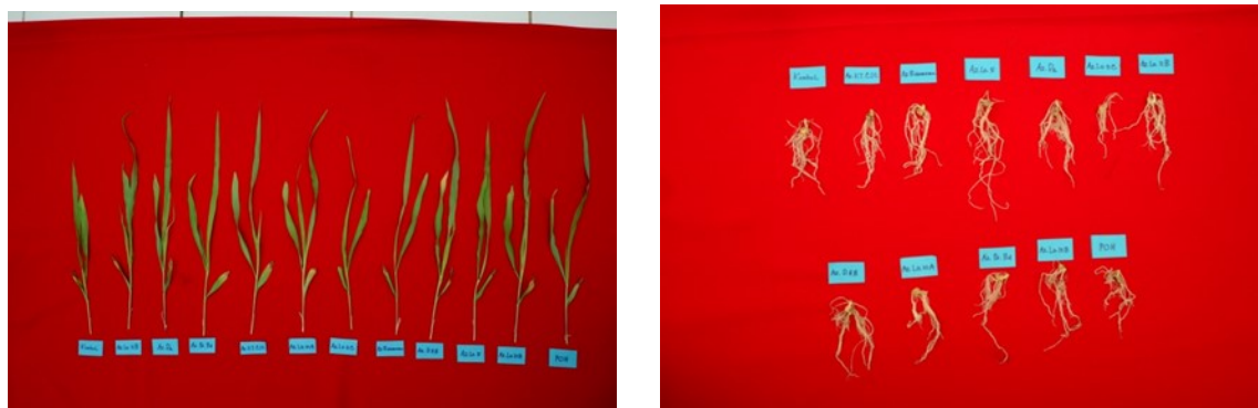
Gambar 1. Foto tanaman dan akar benih jagung umur 15 hari yang diberi perlakuan isolat rhizobakteria

*Angka dengan huruf yang berbeda pada kolom yang sama menunjukkan beda nyata dengan uji Duncan ( \alpha = 0.05 ).