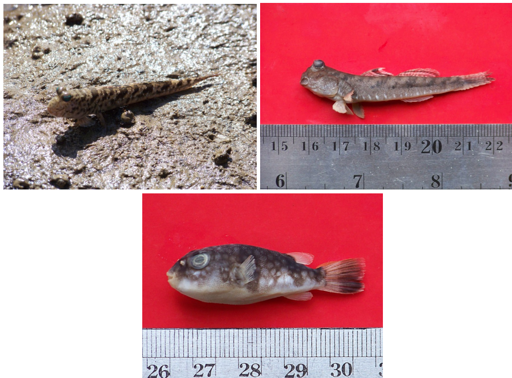
Gambar 1. Boleophthalmus boddarti (1); Periophthalmus argentilineatus (2); Chelonodon patoca (3)

Karakter unik lain ditunjukkan oleh ikan buntal, dengan warna yang begitu indah dan pergerakan relatif lambat namun jangan sampai terkecoh dengan penampilannya. Jenis buntal dalam keadaan yang terdesak akan menggelembungkan diri menyerupai bola, dan memiliki duri-duri tajam. Nontji (1993) menginformasikan bahwa secara umum duri-duri dari jenis buntal mengandung racun.